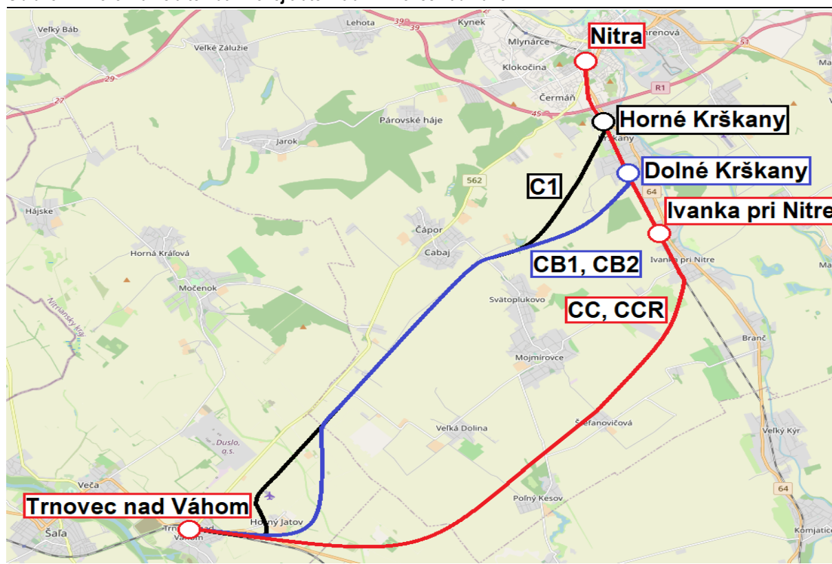
Obrázok 2: Porovnanie alternatív novej trate Nitra – Trnovec nad Váhom

Čierny úsek – trasovanie pôvodnej alternatívy C1 v štúdiu uskutočniteľnosti z roku 2014 s odbočením v Horných Krškanoch